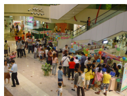
香港普通話研習社科技創意小學