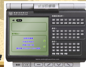
【普普村】網上音節拼讀機